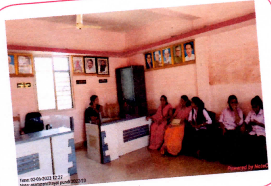
पुणदी ग्रामपंचायत भेटीवेळी महाविद्यालयीन विद्यार्थी