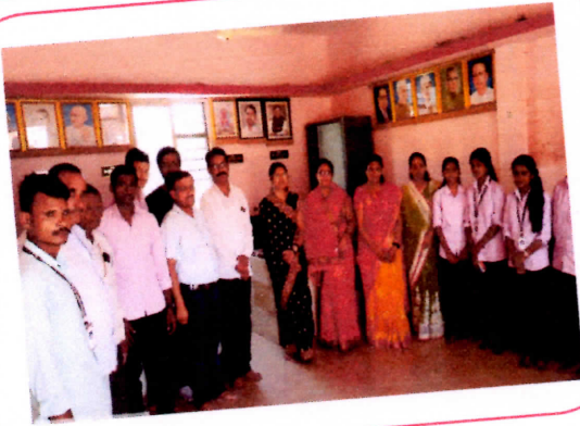
पुणदी ग्रामपंचायत भेटीवेळी ग्रामपंचायतीचे सरपंच व पदाधिकारी